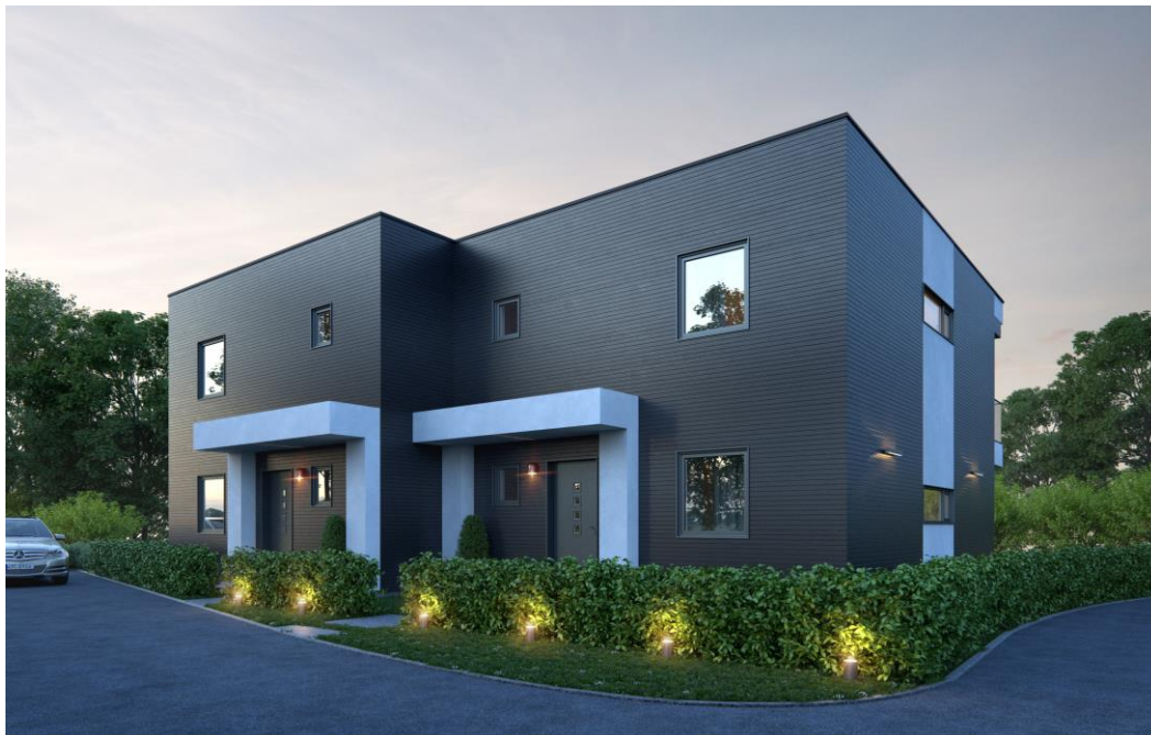
Illustrasjon av fasade, avvik kan forekomme.

Besøksadresse/ postadresse: Borgundfjordvegen 116 6017 Ålesund