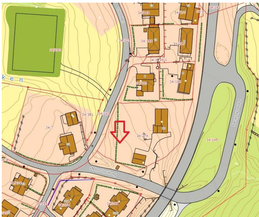
Oversiktskart over eiendommen.

Boligen har svært attraktiv og sentral beliggenhet i Olsvika. Nærhet til sjø og gode turmuligheter på Holsfjellet. Offentlig transport er godt utbygd. Moa med utallige butikker, kino, svømmehall og restauranter ligger kun 2 km unna. Boligen leveres med god og moderne standard.