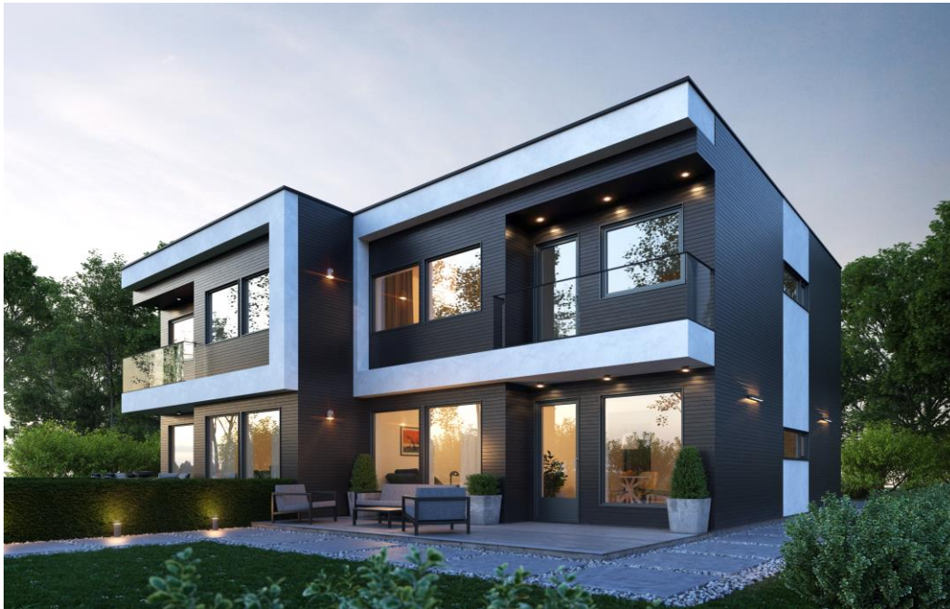
Illustrasjon av fasade , avvik kan forekomme.